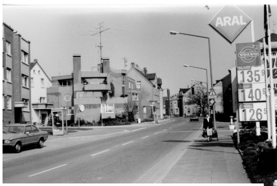
Schützenstraße zu Zeitpunkt des SPD-Wahlversprechen (1979)

Interessant dazu auch die ADAC-Einschätzung, (aber die sollen ja auch „getürkt sein“) [klick]