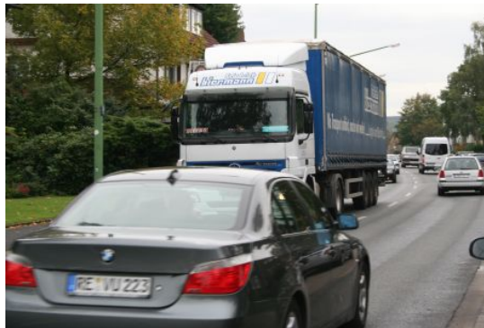
Schützenstraße heute nach demografischer Abnahme des Verkehrs

Apropos Abstimmverhalten. Hier handelt der Rat so, wie die Wettervorhersage. Wird die Abstimmung kritisch, so ist man nicht befangen, trotz Befangenheit. Bei unkritischer Abstimmung erlaubt man sich den Luxus schon einmal, befangen zu sein.