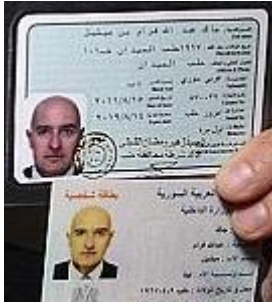
Sehr geehrter Herr Bürgermeister, sehr geehrte Damen und Herren, aufgrund des § 14 der Geschäftsordnung der Stadt Herten stelle ich folgenden Antrag: Hier: In Anlehnung der Erkenntnisse der Stadt Hamm (sh. Anlage) schafft die Stadt Herten ein Dokumentenprüfgerät Begründung: Wie der WDR berichtet[1] hat die Stadt Hamm durch Nutzung dieses ...