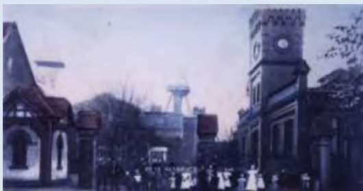
Zeche Schlägel & Eisen I/II in Disteln (vermutlich vor dem 1. Weltkrieg)

Bis etwa 1870 hatte das Stadtgebiet ein dörflich-ländliches Gepräge. Der Einzug des Steinkohlenbergbaus im Jahre 1872 löste eine rasante Entwicklung aus und die Bevölkerungszahl stieg sprunghaft an. Es entstanden zahlreiche Bergarbeitersiedlungen verschiedener Stilrichtungen und Epochen. Noch heute ist die um 1910 erbaute Gartensiedlung in Bertlich in ihrer Struktur erhalten.